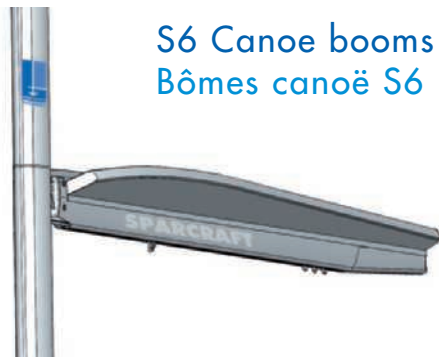
S6 Canoe booms Bômes canoë S6